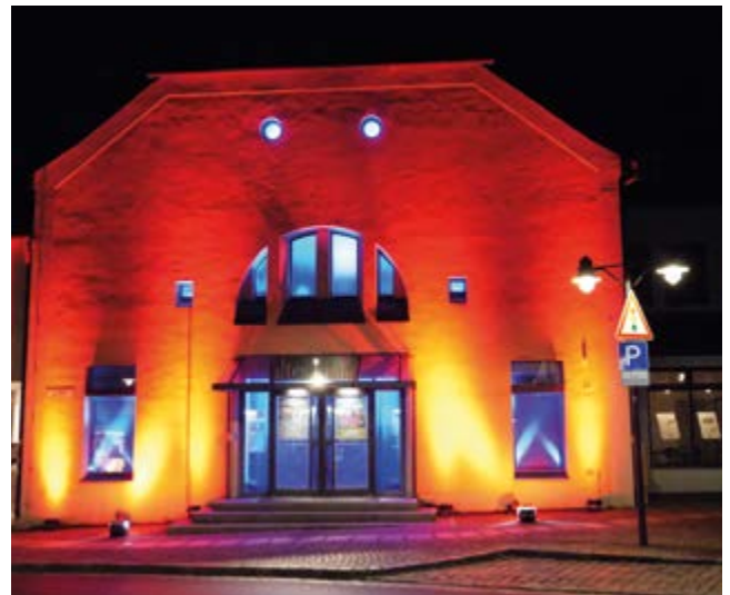
Das alte kino in Ebersberg hat den Ruf eines „bundesweit beachteten Kleinkunsttempels“

Kulturfeuer: Alle zwei Jahre bringt das alte kino mit seinem Sommerfestival magischen Flair in den Klosterbauhof