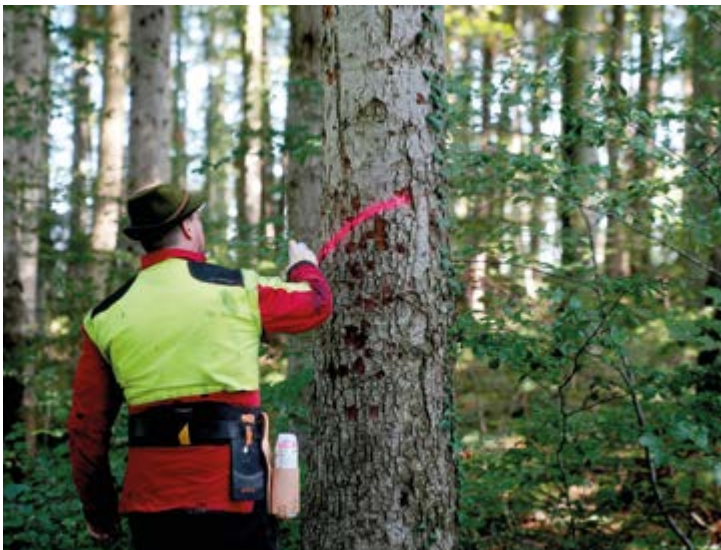
Hiebsplanung und Auszeichnen von Waldbestand