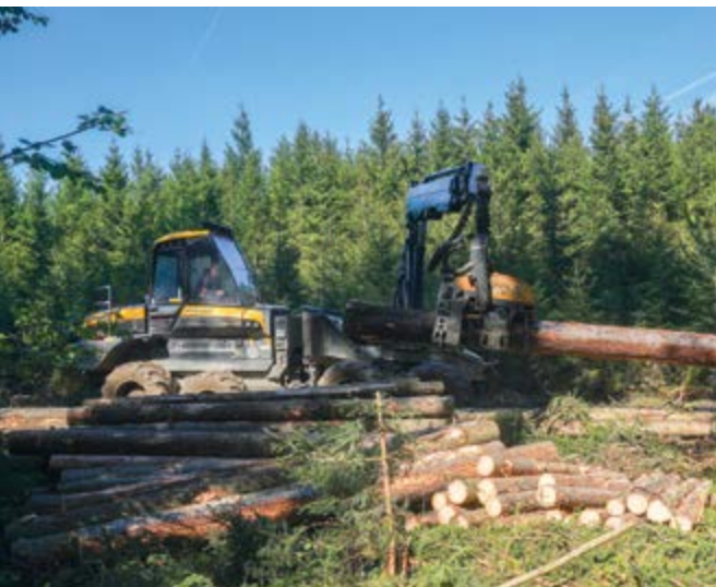
Harvester im Einsatz über der Naturverjüngung