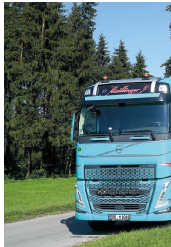
Holztransporter beim Beladen von Rundholz