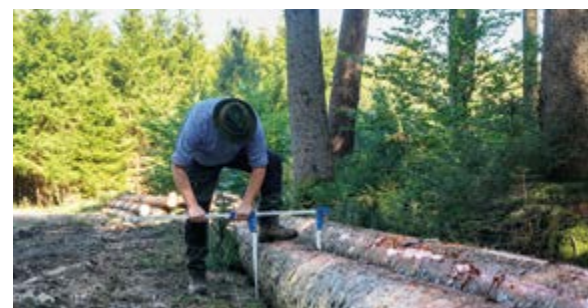
Vermessen und Klassifizieren der Hölzer