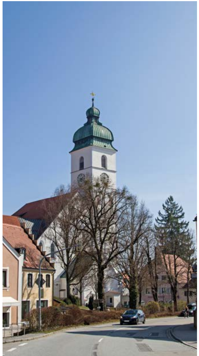
St. Sebastian in Ebersberg